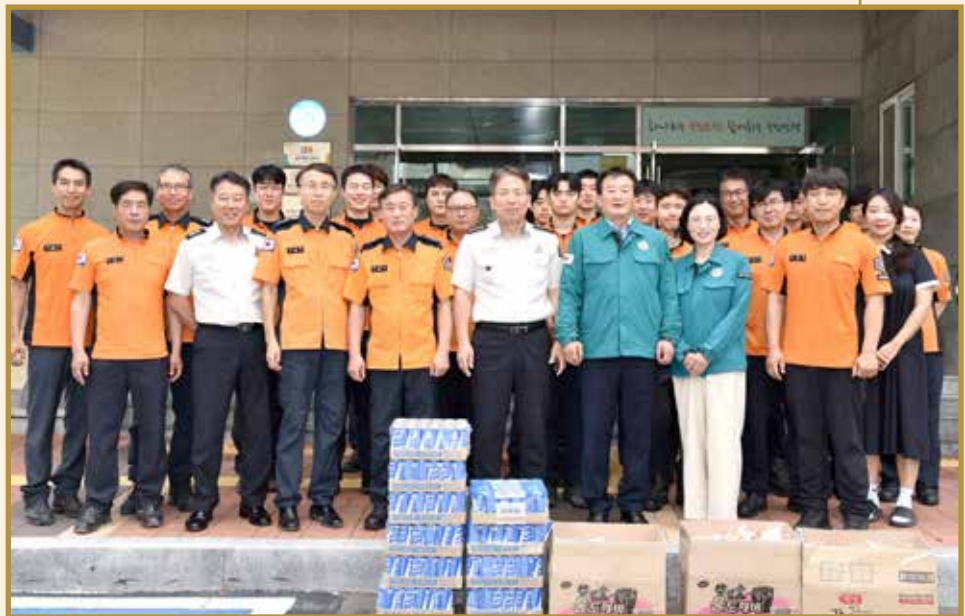
#1 2024. 7. 1. 경산시 청년지식놀이터 개소식