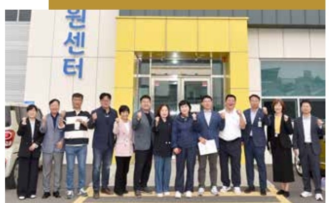
경산시 농산물가공지원센터(제258회 임시회)