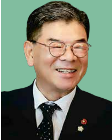
양재영 의원 [제257회 임시회]

우리 시는 22년 12월, 생활폐기물 위생매립장의 사용기간 연장과 매립용량 증설 추진에 대한 협약을 맺어 2040년까지는 매립장 사용 문제를 해결해놓은 상황이다.