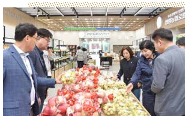
압량농협 로컬푸드 직매장(제258회 임시회)