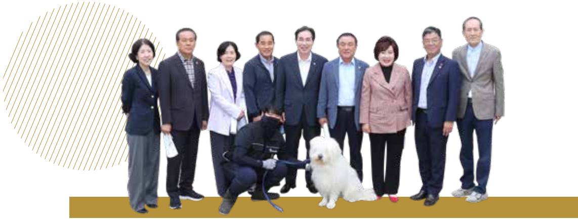
경산의삼살개육종연구소 (제258회 임시회)