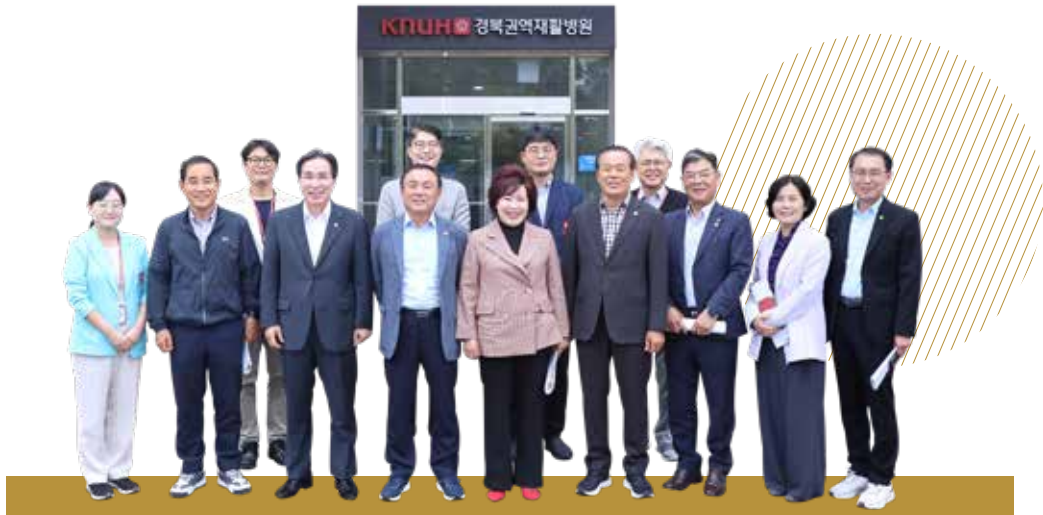
경북권역재활병원 (제258회 임시회)